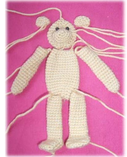
So sehen die Einzelteile vor dem Stopfen aus